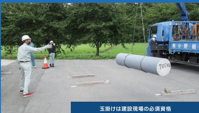
玉掛けは建設現場の必須資格