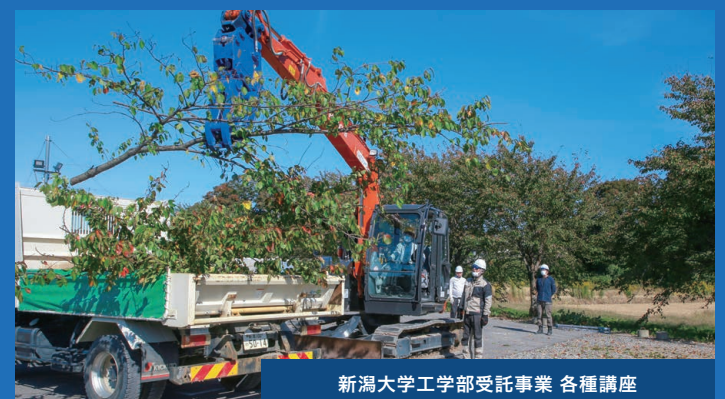
新潟大学工学部受託事業 各種講座