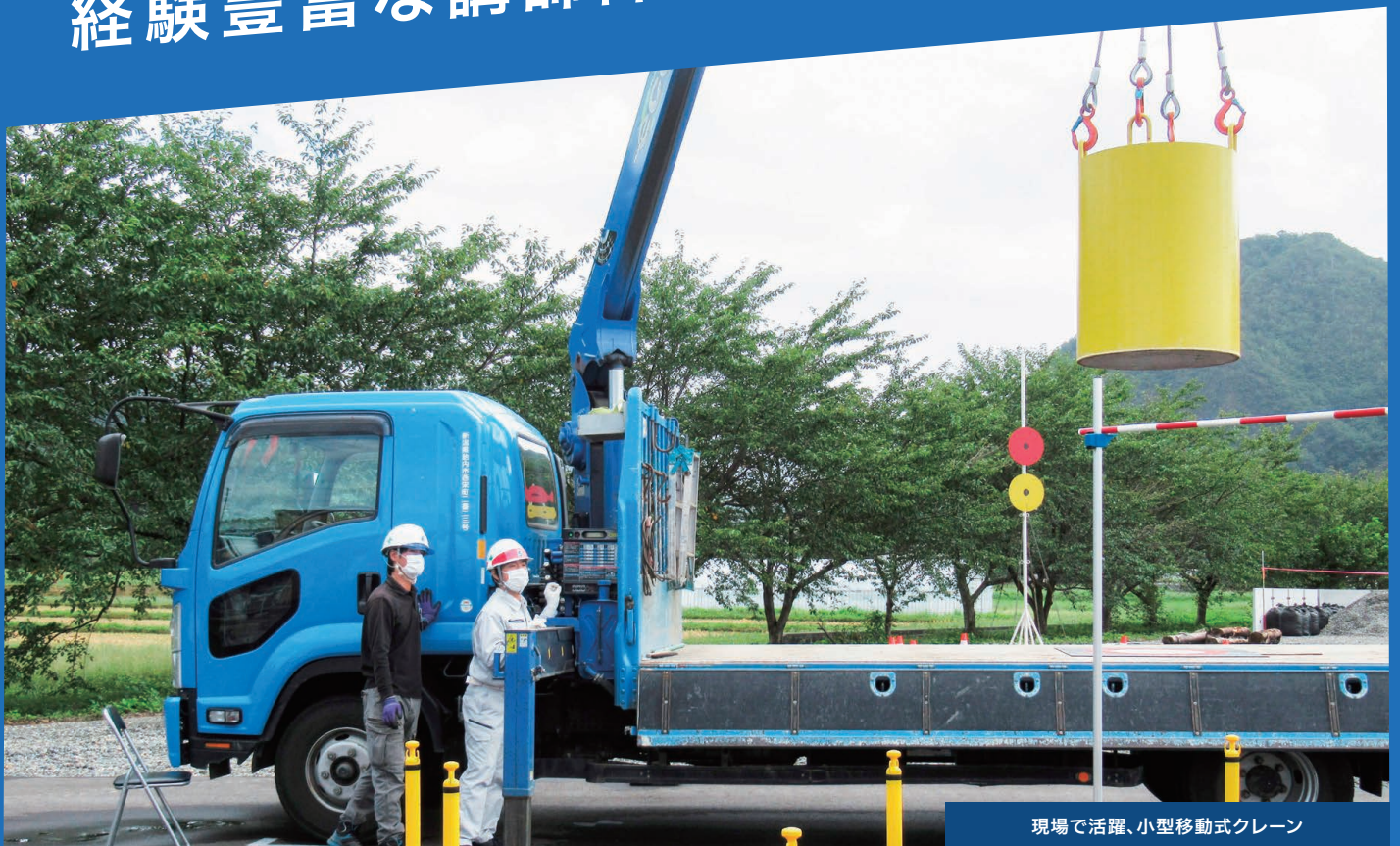
現場で活躍、小型移動式クレーン