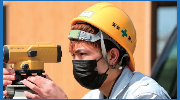
建設業の未来を担う人材育成 建設業新人研修