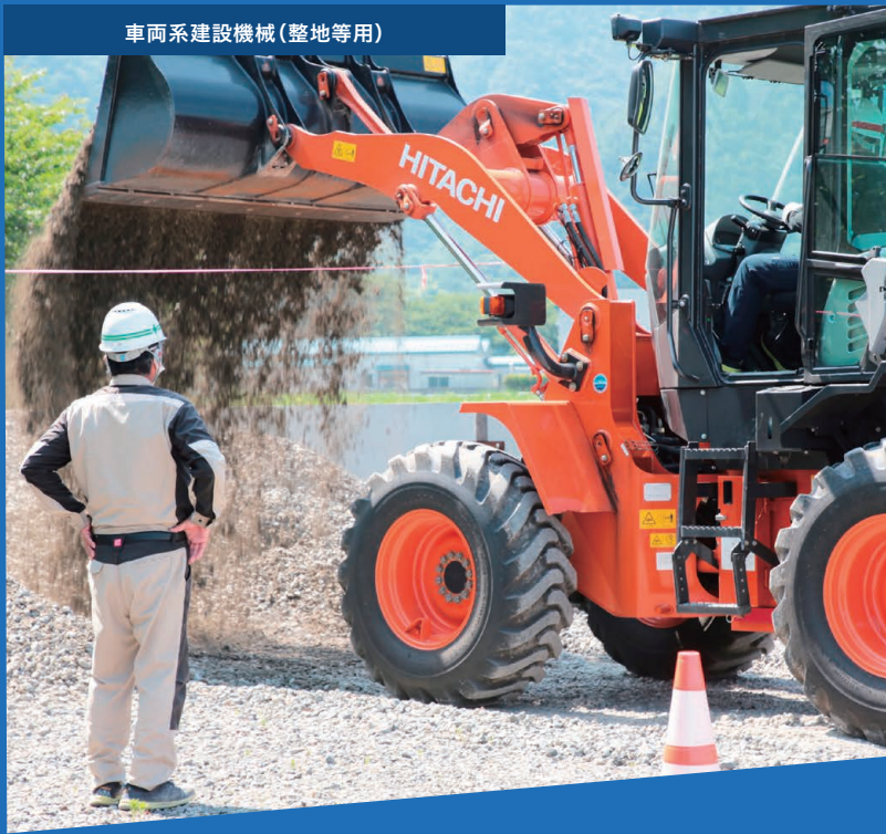
車両系建設機械(整地等用)